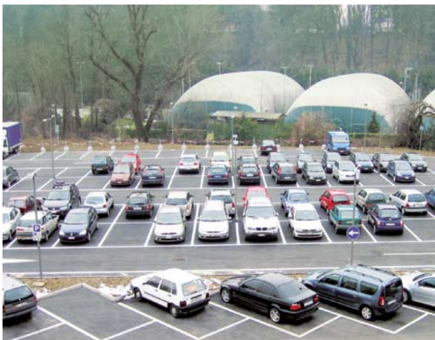
Alcune immagini dell'area su cui sorge il parcheggio di via Libertà.

L'area su cui sorge, come è noto, appartiene in maggior parte al Comune di Usmate ed in minor parte a quello di Carnate e la sua ristrutturazione è stata sostenuta con l'ausilio finanziario della Provincia, che è intervenuta con € 500.000, mentre RFI si è fatta carico dei costi relativi alla progettazione