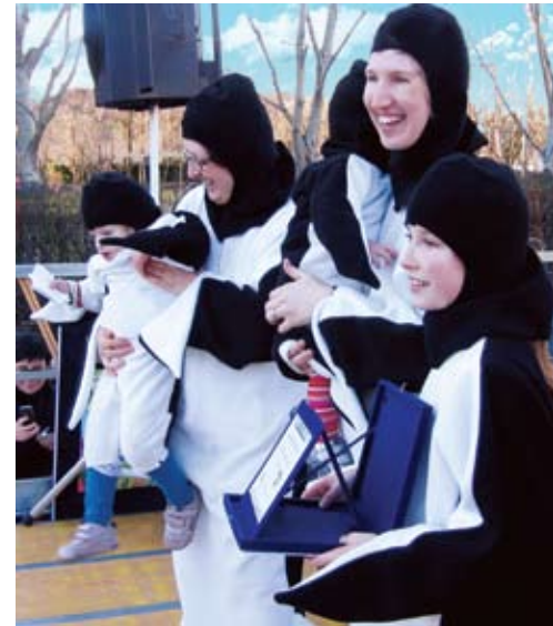
Alcune immagini della festa di Carnevale, spettacolo coinvolgente... non solo per i bambini.