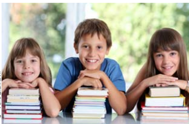
5 • FOTO DIGITALART

Richiedere la Dote è semplicissimo: basta presentare un'unica domanda on-line sul sito www.regione.lombardia.it dove si può trovare anche l'entità del contributo, oppure rivolgersi all'Ufficio Scuola del Comune di Carnate, previo appuntamento, fino al 30 aprile 2010.