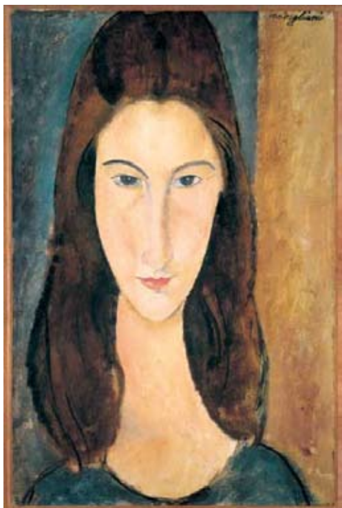
Amedeo Modigliani, Testa di Jeanne Hébuterne, 1916.

Per festeggiare la giornata delle donne è stata allestita una mostra al femminile avente per tema il "ritratto"