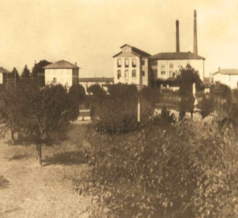
La Filanda con le sue ciminiere, nella foto a sinistra. Via Barassi e le scuole elementari, 1925.

la è situata in una posizione particolarmente favorevole, con l'ampio cortile ed il parco che dominano la vallata del Molgora. Accanto alla villa fu edificato un tempietto con un piccolo campanile, noto come "cappella di S. Probo".