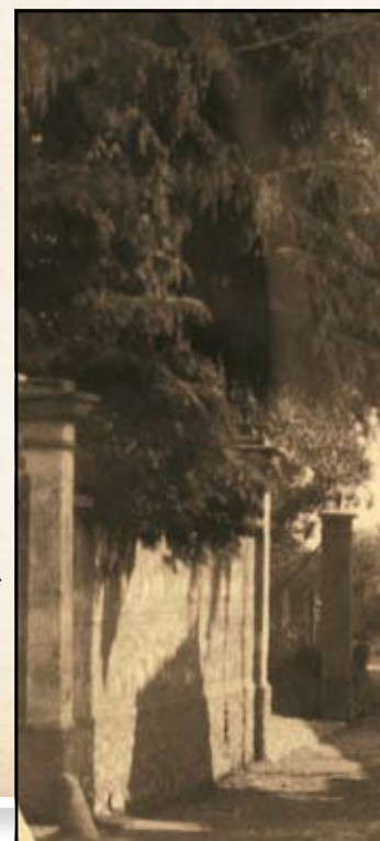
Via Barassi e il filatoio, 1930.