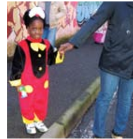
5 • FOTO SERGIO BONO