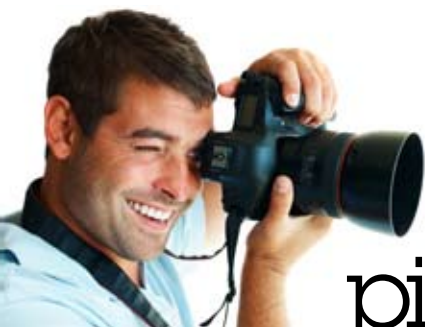
2 • FOTO DIGITALART