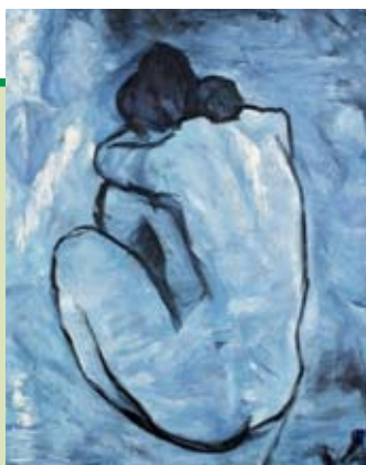
Pablo Picasso, Blu Nude, 1902.

Viviamo queste notizie come se fossero una realtà distante, che non ci riguarda. Nulla di più falso, non dimentichiamo che questi incresciosi eventi possono essere fermati, basta solo la collaborazione di tutte. Il consiglio che viene ripetuto continuamente è quello di non