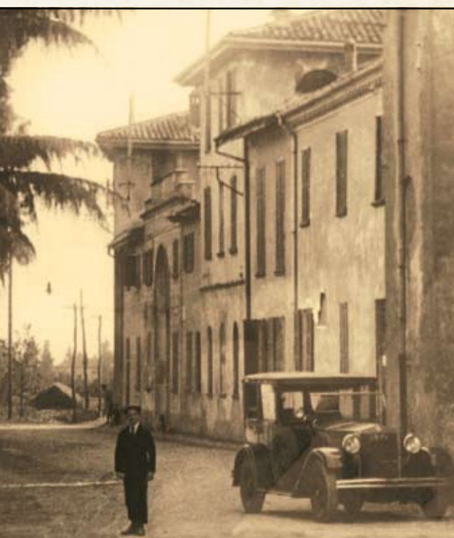
5 • FOTO FAUSTO CARZANGA

La costruzione della villa risale al 1685 ad opera dei primi proprietari, i conti Fornari. Successivamente passò in proprietà alla famiglia Prinetti ed infine alla famiglia Banfi. La vil-