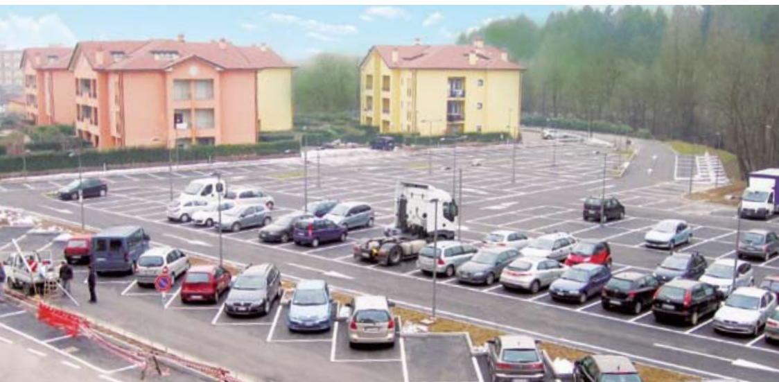
2 • FOTO SERGIO BONO