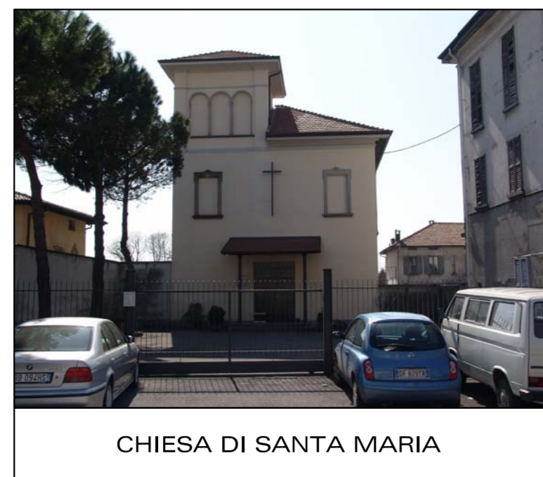
CHIESA DI SANTA MARIA