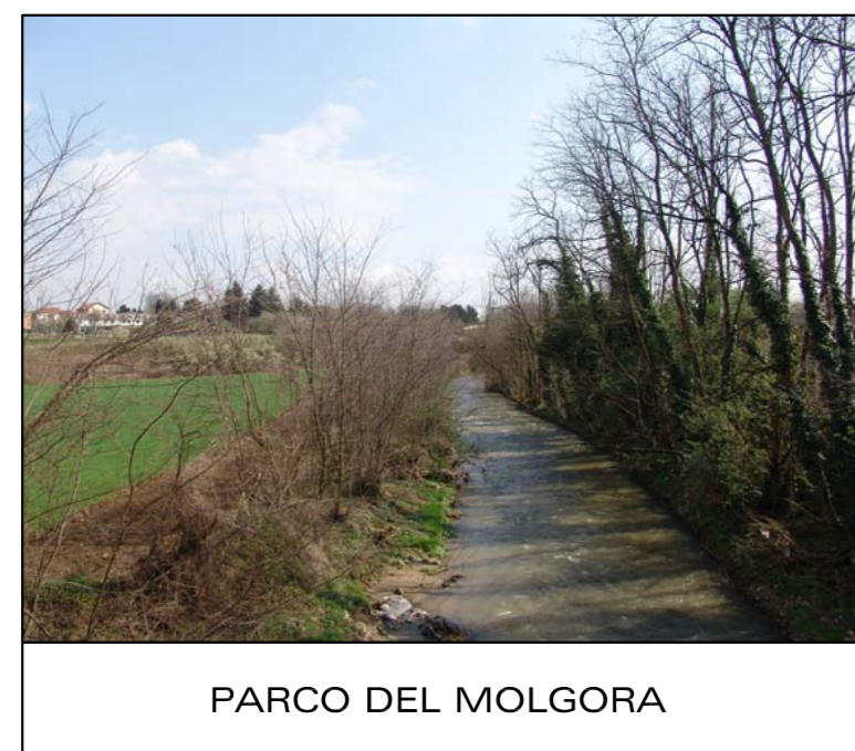
PARCO DEL MOLGORA