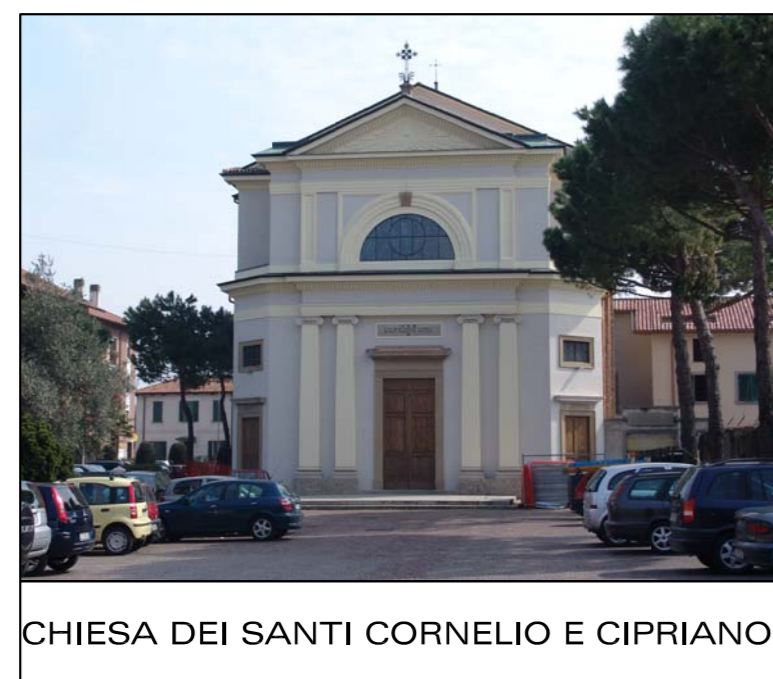
CHIESA DEI SANTI CORNELIO E CIPRIANO