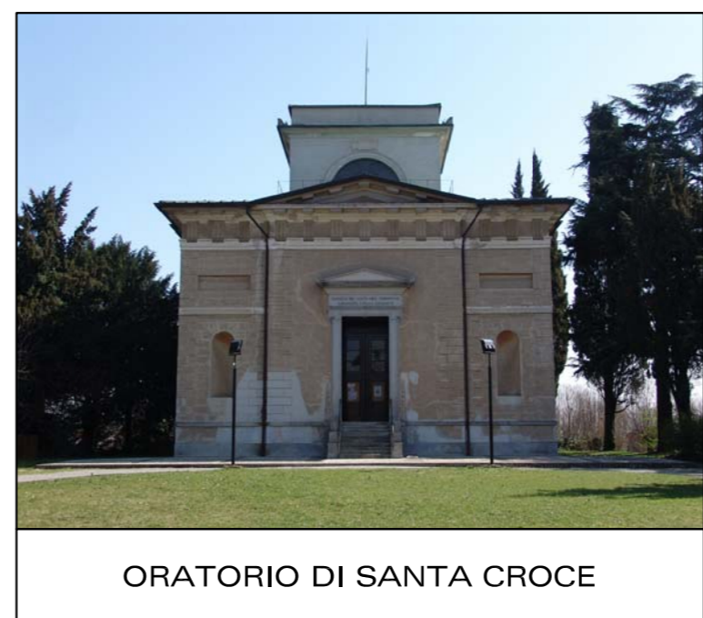
ORATORIO DI SANTA CROCE