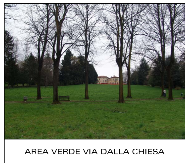
AREA VERDE VIA DALLA CHIESA