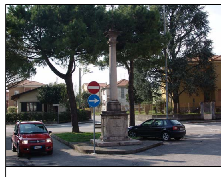
MONUMENTO DI PIAZZA PIO XII