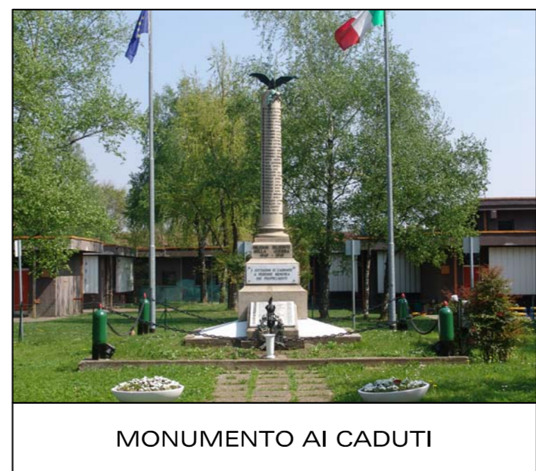
MONUMENTO AI CADUTI